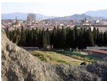
Imagen de la zona donde se ubicará el cementerio musulmán

finales de septiembre, según recoge en sus páginas el diario 'La Rioja'.