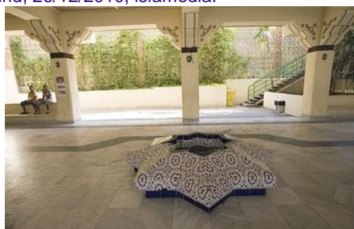
Patio de entrada a la Mezquita Central de Madrid

Se ha reunido la Junta Directiva General de la Unión de Comunidades Islámicas de España en su sede central en Madrid, el domingo, 26.12.2010, con la presencia de todos sus miembros.